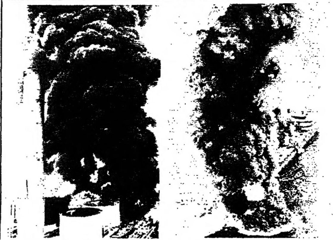
الحريق في منطقة النفط .. وفي الحساء البحرية

النفط يحترق .. خلال اسبوع احترقت ثلاثة البترول البريطانية « غلوبوك من » في خليج المكسيك ، حيث فقد خمسة من البتراء بينما غادرها ١٦ ، وفي فاندلها شمس حريق في منطقة اميركا ضخمة تابعة لشركة « غالف اول » . وقد فقد ايضا في هذا الحريق بالاضافة الى اطنان من النفط ، ٧ رجال اطفاء